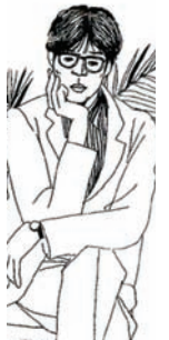
文・写真 北原元気

電車…名古屋から名古屋鉄道、中部国際空港行き常滑駅下車。 車…名古屋高速より知多半島道路へ入り南知多方面へ。半田 中央ジャンクションよりセントレアラインで空港方面へ進み 常滑ICで降りる。