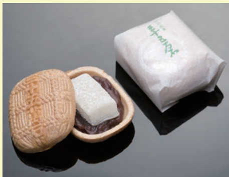
協力 菓心 おおすが 彦根市中央町4番39号 tel.0120-22-5722 http://www.kashin-ohsuga.com