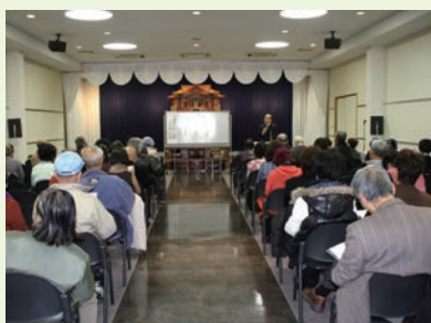
▶2015年1月28日 終活セミナーの様子