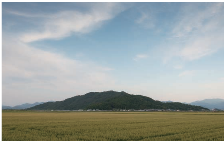
▶彦根市 荒神山 山全体が大和王朝成立以前の「前方後方墳」として注目されている。墓は歴史の記憶装置だ。誰かがふり返ろうとした時、或いは、何かを見出そうとしたとき初めて意味を持つ。個人のレベルでもそれは同じだ。

様々な人間模様を描きながら、自分や妻と向き合ううちに、人の心の奥底に「生きる」ということを色々な形で問いかけている。最後は妻の望み通り、骨を故郷の海で撒く。この映画では人を葬るひとつの形として散骨に焦点をあてている。しかし、その主題は「生きる」という意味を生と死を通し