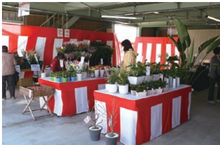
▶観葉植物もたくさん♪

IRIS 恒例の「春の花まつり」には、晴天に恵まれた初日から、たくさんのお客様にご来店いただきました。