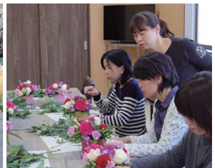
▶みなさん、真剣な表情です!!