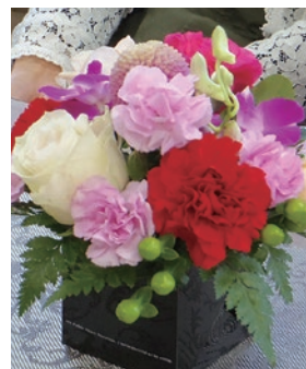
▶かわいらしくできました♪