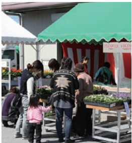
▶いろいろな花苗バイキング