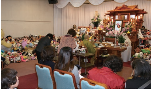
▶人形法要祭 たくさんの方がお参りくださいました。

なお、当日お供えいただきましたご芳志は、当社が支援しております東北震災孤児支援団体へ全額寄付させていただきますことご報告申し上げます。(葬祭部：深尾祥正)