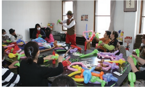
▶ウッディ君のバルーンアート教室