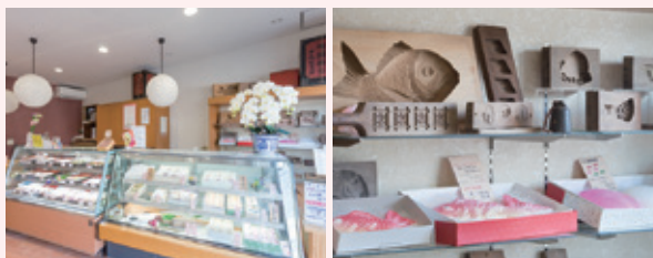
協力 中嶋製菓舗 彦根市平田町966-1・tel.0749-23-0276