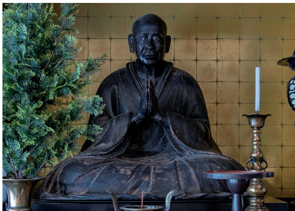
▶目尻と目元がほのかに赤く生きているかのようである

ところで、高宮寺は井伊直孝公の代より、彦根城内の時報鐘を撞く役を明治維新まで務めていたことは、ほとんど知られていない。