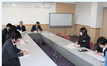
▶ オープニングミーティング

不適合の指摘はなく、いただいた改善の機会を今後の組織の活性化につなげます。これからも全社員の取り組みとして適切な維持管理に努めてまいります。