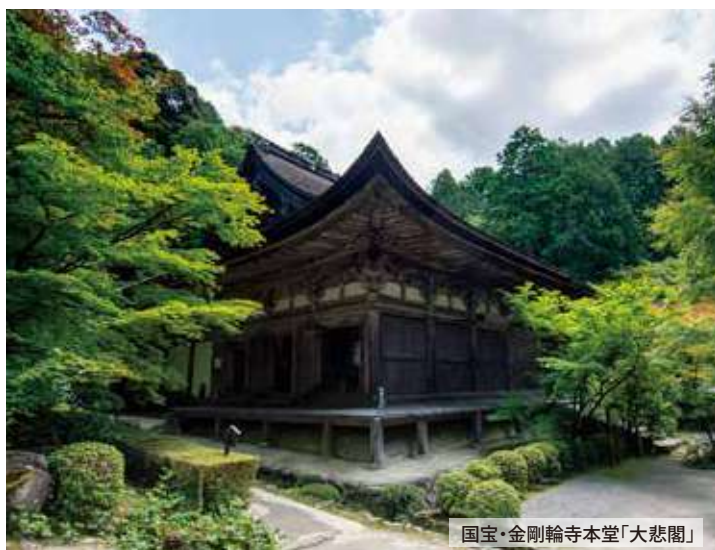
国宝・金剛輪寺本堂「大悲閣」

「油かえそう。わずかのことに……」と唱える油坊主を想像しながら「大悲閣」まで……参道の長い坂道を登ってみたい。 雲行