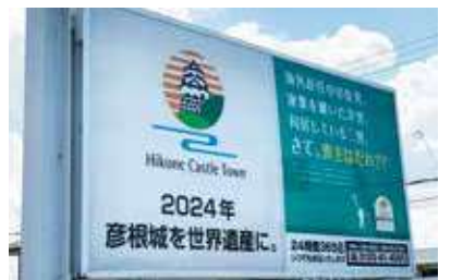
▶南彦根、くすのき通り沿いにある公益社の看板

公益社は、彦根城の世界遺産登録の気運が盛り上がるよう応援し、日本一の湖を有する滋賀県と、歴史と文化に培われた彦根市が世界に誇れる都市となることを願っています。